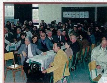
Φωτογραφία από την περυσινή Γενική Συνέλευση

Μετά τη Γενική Συνέλευση θα ακολουθήσει η κοπή της πρωτοχρονιάτικης πίτας καθώς και μεζές με κρασί. Παρακαλούνται όλα τα μέλη να παρευρεθούν στην Γενική Συνέλευση.