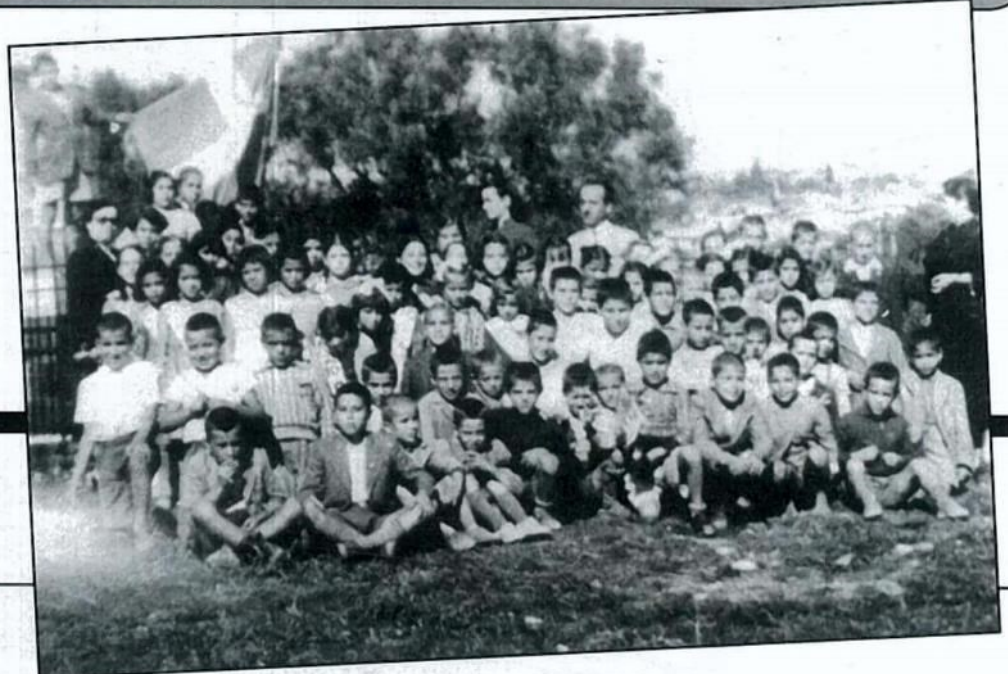
Αγαπητέ μου πρόεδρε