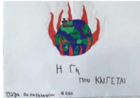
Όλγα Παπαδημητρίου, 11 ετών