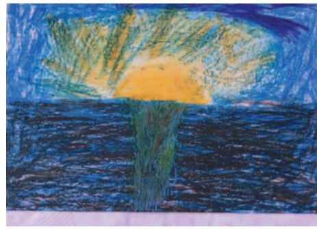
Ευαγγελία Νικολιά, 9 ετών