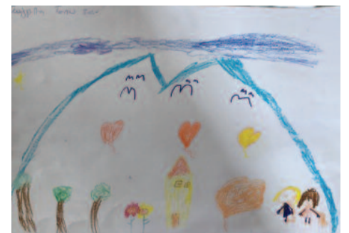
Ευαγγελία Τσίπου, 8 ετών