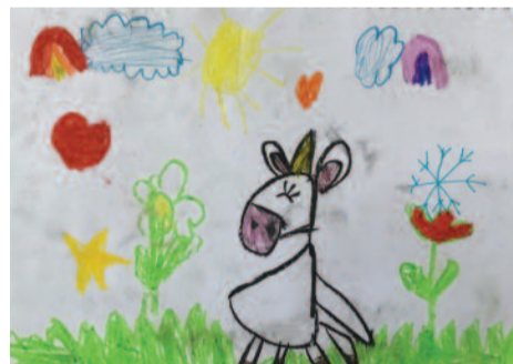
Θεοδοσία Μπελιά, 6 ετών