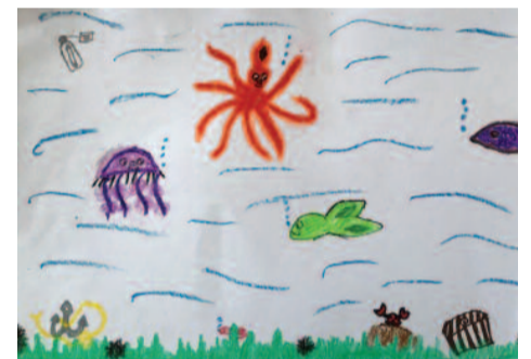
Χρυσάλια Τσεκούρα, 9 ετών