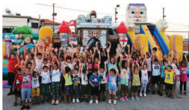
Συνέχεια από τη σελ. 1

μαζί με τους γονείς τους να έρθουν στο χωριό μας για να διασκεδάσουν, να γελάσουν, να συναναστραφούν με άλλα παιδάκια και να παίξουν με τα φουσκωτά που στήθηκαν στο γήπεδο των Ανδρονιάνων από τον Προοδευτικό Σύλλογο Ανδρονιάνων-Δένδρων για αυτά.