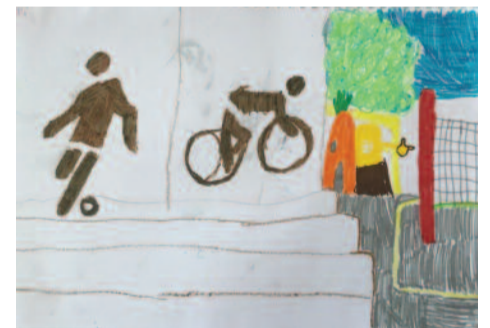
Μαρίλια Πόγκα, 11 ετών