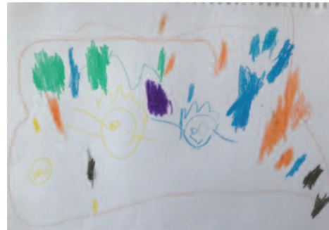
Αναστασία Μιχαήλ, 4 ετών