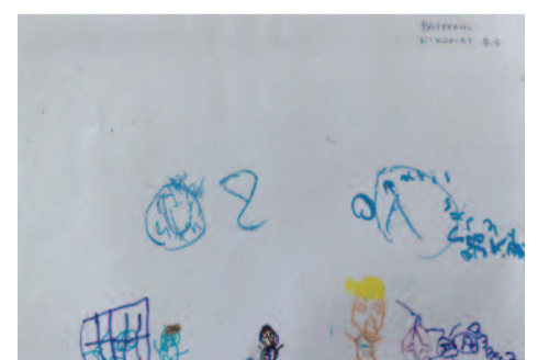
Βαγγέλης Νικολιάς, 8,5 ετών