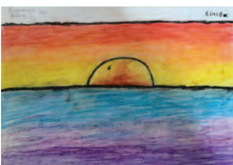
Αριάδνη Αναγνωστοπούλου, 11 ετών