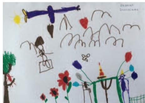
Ραφαήλ Σκουλίκας, 5 ετών