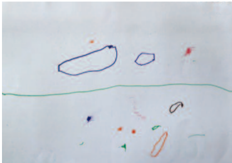
Γιώργος Ζέρβας, 3 ετών