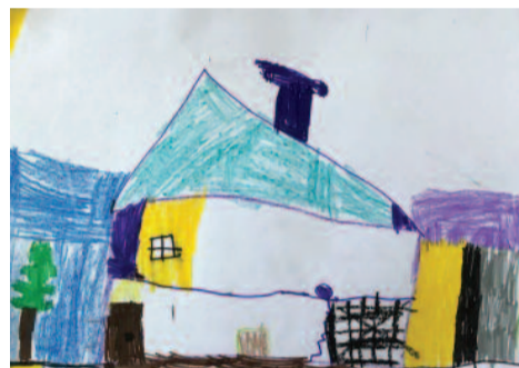
Θανάσης-Φώτης Κωνσταντίνου, 7 ετών