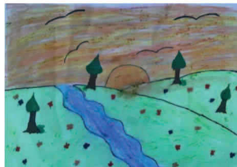
Ιωάννα Μπελιά, 11 ετών