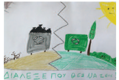
Ευαγγελία Τσομάκα, 12 ετών