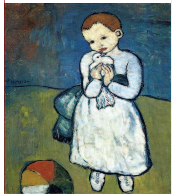
P. Picasso "Child with a Dove"

ΓΙΑΝΝΗΣ ΡΙΤΣΟΣ-ΕΙΡΗΝΗ, ΑΘΗΝΑ, Γενάρης 1953