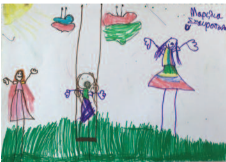
Μαρίλια Σταυροπούλου, 7 ετών