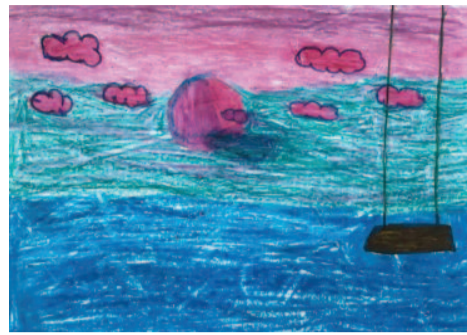
Άννα-Μαρία Ποντίκη, 10 ετών