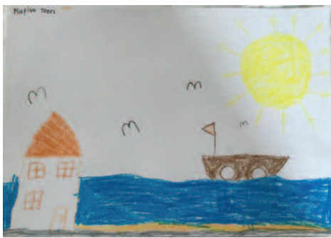
Μαρίνα Τότσι, 9 ετών