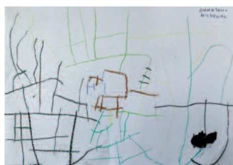
Δημήτρης Μυλωνάς, 4,5 ετών