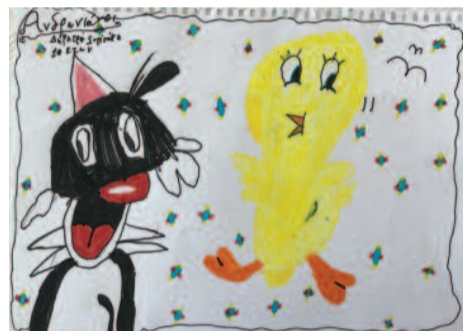
Δήμητρα Συρινάκη, 10 ετών