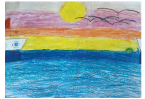
Κατερίνα Νικολιά, 12 ετών