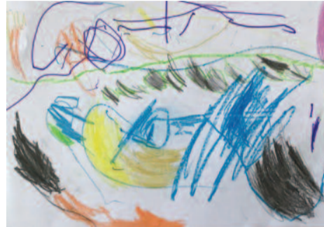
Δημήτρης Μπελιάς, 3,5 ετών