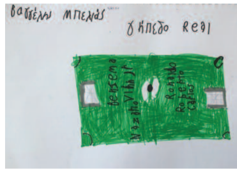
Βαγγέλης Μπελιάς, 9 ετών