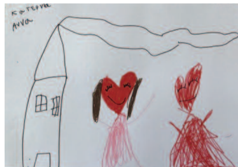
Κατερίνα Βλαστάρη, 5 ετών