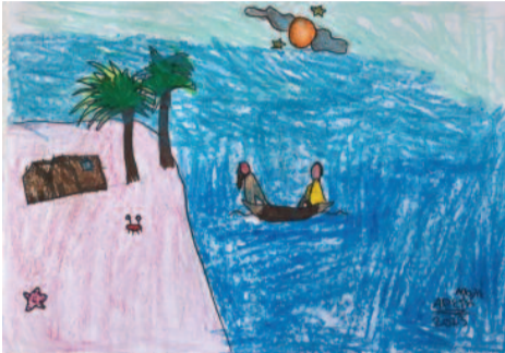
Αρετή Μολέ, 8 ετών