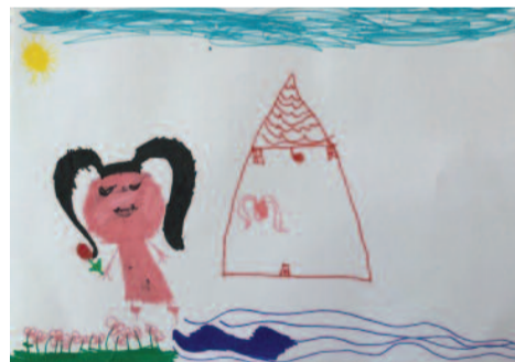
Ελπίδα Σκιρλή, 6,5 ετών