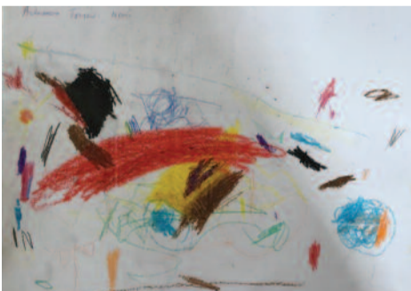
Αθανασία Τσίπου, 4 ετών