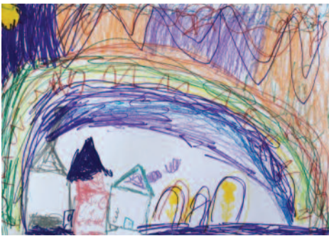
Παναγιώτης-Άγγελος Κωνσταντίνου, 7 ετών