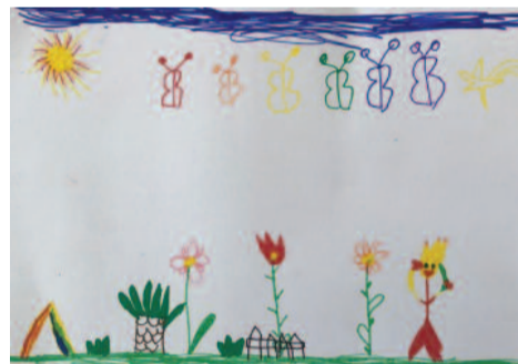
Μαρία Λιβανίου, 6 ετών