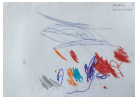
Θανάσης Σκουλίκας, 3 ετών