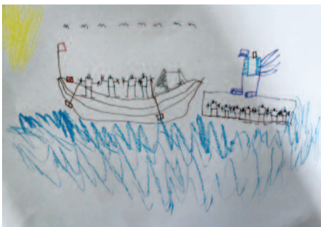
Νοέα Τότσι, 8 ετών