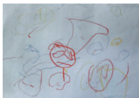
Αντώνης Βλαστάρης, 3 ετών