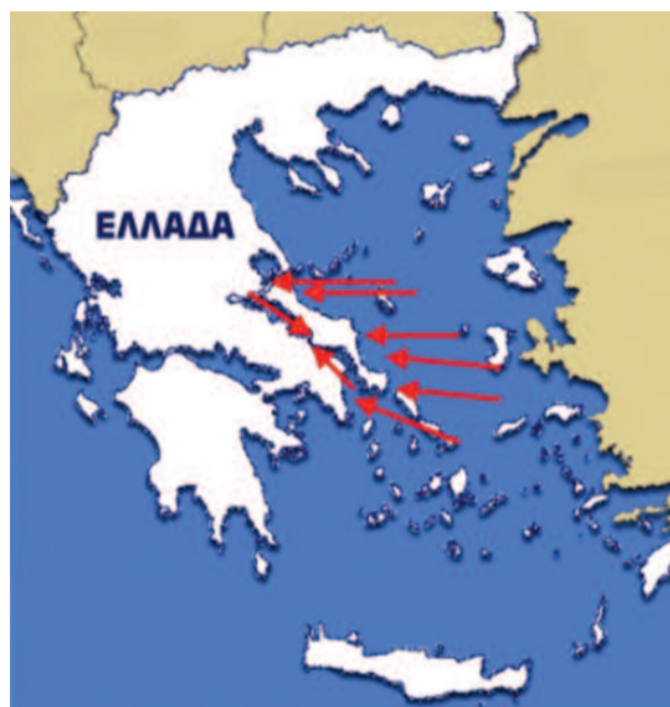
Εικόνα 5: Η φορά του διχασμένου παλιρροϊκού κύματος του Αιγαίου όπως αυτό εισέρχεται στο Νότιο και Βόρειο Ευβοϊκό κόλπο. Το κύμα που μπαίνει στο Νότιο Ευβοϊκό Κόλπο φθάνει στο στενό του Ευρίπου 1 ώρα και 15 λεπτά νωρίτερα από το κύμα που φθάνει από το βορρά γιατί η διαδρομή που ακολουθεί είναι μικρότερη.

Κατά την Πανσέληνο και τη Νέα Σελήνη, οπότε οι παλίρροιες είναι περισσότερο έντονες, έχουμε μεγαλύτερη διαφορά στάθμης μεταξύ Βορείου και Νοτίου Ευβοϊκού Κόλπου και, επομένως, ισχυρότερο ρεύμα. Η περίοδος των 22 ωρών και 22 λεπτών πρέπει να αποδοθεί στη διαμόρφωση των ακτών των δύο πλευρών του Ευβοϊκού κόλπου. Κατά την εποχή του πρώτου και τελευταίου τετάρτου της Σελήνης οι παλίρροιες δεν είναι έντονες και επομένως και τα κύματα που εισέρχονται στους δύο κόλπους είναι εξασθενημένα. Όλα αυτά συν η μορφολογία των ακτών, του βυθού και η φορά των ανέμων συμβάλλουν ώστε η ροή των υδάτων να είναι εντελώς ακανόνιστη.