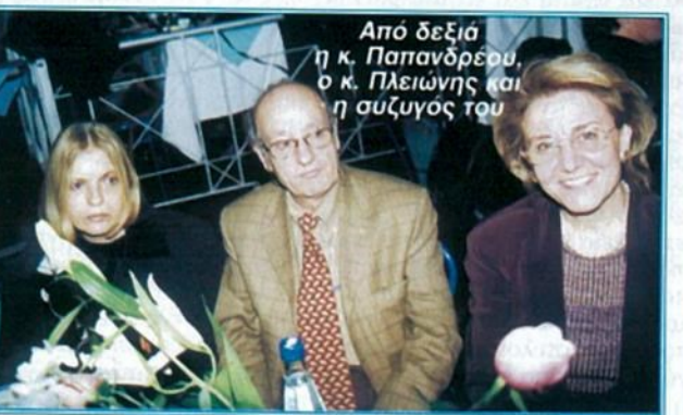
Από δεξιά η κ. Παπανδρέου, ο κ. Πλειώνης και η σύζυγός του