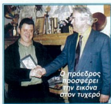
Ο πρόεδρος προσφέρει την εικόνα στον τυχερό