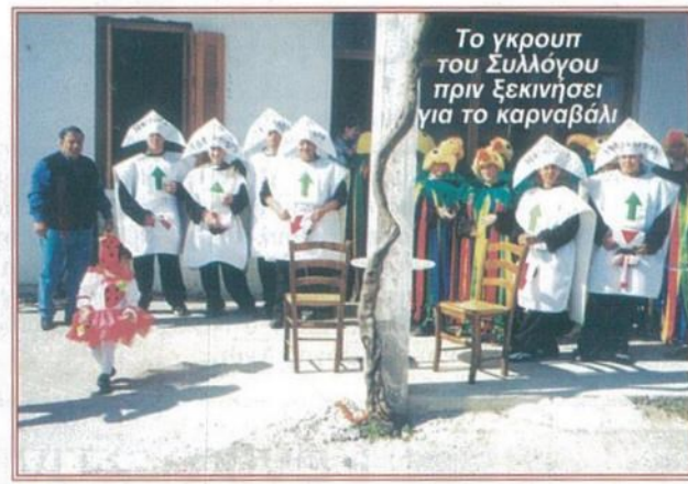
Το γκρουπ του Συλλόγου πριν ξεκινήσει για το καρναβάλι

Σήμερα δε, βλέπω ότι έχει φοβερή συμμετοχή από κόσμο, κάτι που σημαίνει ότι έχει καταξιωθεί πλέον στην