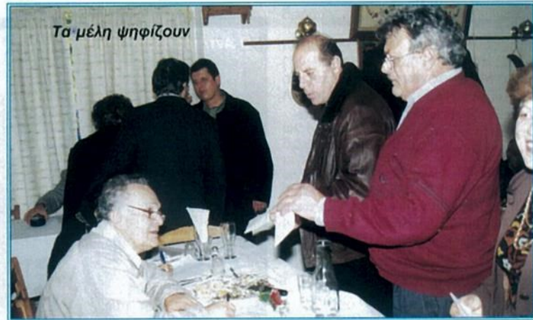
Τα μέλη ψηφίζουν