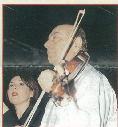
Ο Πύργος Κόρος μίλησε ξανά με το βιολί του. Μίλησε όπως πάντα μελωδικά, ανθρώπινα βαθιά μέσα στη καρδιά μας.