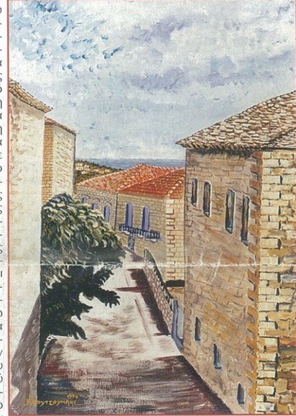
Πίνακας ζωγραφικής Νίκου Κουτσούμη

του Συλλόγου για να εκφράσουν προσωπικά τα συχαρητήριά τους, να μας ευχθούν καλό κουράγιο για τη συνέχεια, να γραφτούν μέλη και να ενισχύσουν με το βαλάντιό τους το Σύλλογό μας στις προσπάθειές του. Παραθέ-τουμε στη συνέχεια μέρος της αλληλο-γραφίας και ζητάμε συγ-γνωμή απ'αυτούς που λό-γω χώρου δεν θα τους ανα-φέρουμε. Τον τίτλο του άρθρου αυτού τον δανεισθή-καμε από το γράμμα του