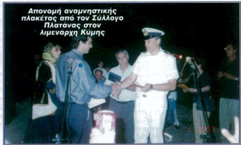
Απονομή αναμνηστικής πλακέτας από τον Σύλλογο Πλατάνας στον Λιμενάρχη Κύμης

Η εφημερίδα μας συγχαίρει τους διοργανωτές της εκδήλωσης.