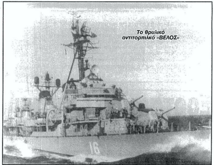
Το θρωλικό αντιτορπιλικό «ΒΕΛΟΣ»

Τον πανηγυρικό της ημέρας εξεφώνησε ο συμπαινώτης μας ηρωικός Ναύαρχος ε.α. Νίκος Παππάς ο οποίος καταχειροκροτήθηκε. Κατά την ομιλία του ανεφέρθηκε στον Αντιδικτατορικό Αγώνα, τον οποίον έκαναν οι Αξιωματικοί των Ενόπλων Δυνάμεων - Στρατού, Ναυτικού, Αεροπορίας - κατά τη διάρκεια της επταετίας της Χούντας, ως και τις διώξεις, ταπεινώσεις και τα βασανιστήρια που υπέστησαν πολλοί εξ αυτών. Εν συνεχεία, περιέγραψε τη μεγάλη απόφαση, που πήρε ως κυβερνήτης του Α/Τ ΒΕΛΟΣ, κατά τη διάρκεια της Νατοϊκής άσκησης στο Ιόνιο με έτερα πλοία των συμμάχων χωρών, όπου και πληροφορήθηκε την αναβολή του κινήματος του Ναυτικού και τις συλλήψεις αξιωματικών ύστερα από προδοσία. Αμέσως συνέταξε σήμα προς όλες τις νατοϊκές αρχές, με το οποίο τους γνωστοποίησε την απόφασή του να στασιάσει κατά του καθεστώτος των συνταγματαρχών