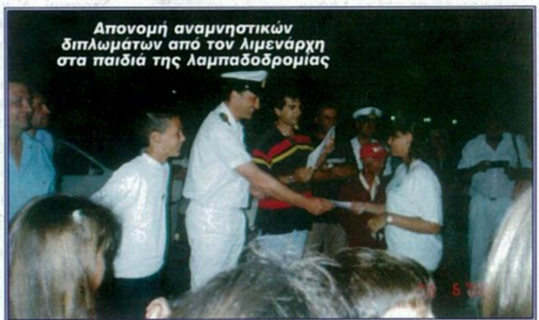
Απονομή αναμνηστικών διπλωμάτων από τον Λιμενάρχη στα παιδιά της λαμπαδοδρομίας