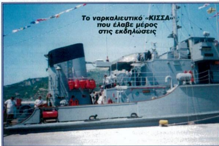
Το ναρκαλιευτικό «ΚΙΣΣΑ» που έλαβε μέρος στις εκδηλώσεις

συνη Δέηση παρουσία Τοπικών Αρχών. Ρύψη στεφάνου στη θάλασσα από το Δήμαρχο Κύμης. Ρύψη πυροτεχνημάτων, Δεξίωση. Οι εκδηλώσεις έγιναν από τους φορείς: Υπολιμεναρχείο Κύμης Ανωτάτη Σχολή Εμπορικού Ναυτικού Κύμης Δήμοι Κύμης Λιμενικό Ταμείο Κύμης Πολιτιστικός Σύλλογος Πλατάνας