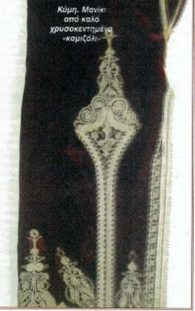
Κύμη, Μανίε από καλό χρυσοκέντημένο «κομζόλι»