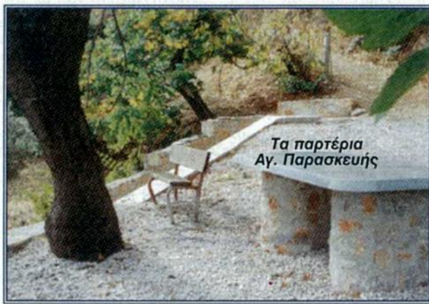
Τα παρτέρια Αγ. Παρασκευής

Οι μέχρι τώρα εργασίες αποτελούν μέρος μιας σειράς προσαρμογών, που καταβάλλονται, με σκοπό την αναβάθμιση του χωριού των Ανδρονιάνων, προσπάθειες που τις περισσότερες φορές έχουν υποκινητές την προσωπική θέληση, την συλλογική προσπάθεια και την ελπίδα, ότι αυτές θα αποτελέ-