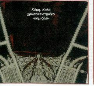
Κύμη, Καλό χρυσοκέντημένο «κομζόλι»