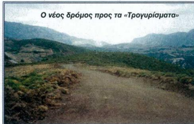
Ο νέος δρόμος προς τα «Τρογυρίσματα»