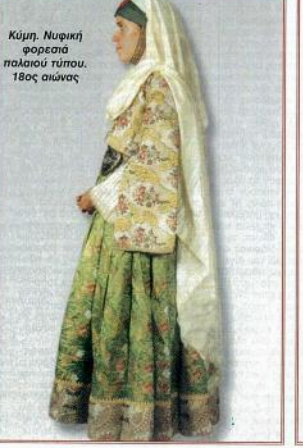
Κύμη, Νυφική φορεσιά παλαιού τύπου, 18ος αιώνας