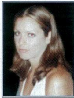
Γράφει η Αικατερίνη Σακκή

Τη συνεχή αυτή προσπάθεια έρχεται να ενισχύσει σε σημαντικό βαθμό, η έκδηλη επιθυμία των παλαιότερων γενεών να εξασφαλίσουν τις καλύτερες προϋποθέσεις για τη διατήρηση της ζωτικότητας του χωριού και τη συχνότερη επίσκεψή του από τους