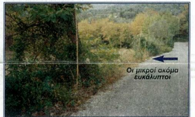
Οι μικροί ακόμα ευκάλυπτοι

Η λειτουργία του θα αρχίσει μετά το τέλος του 2000 με την ελπίδα ότι οι νέες γενιές θα εκμεταλ-