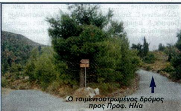
Ο τσιμεντοστρωμένος δρόμος προς Προφ. Ηλία