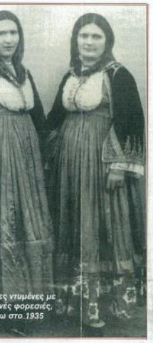
Γυναίκες ντυμένες με γιορτινές φορεσιές, γύρω στο 1935

Η Εύβοια ακολούθησε γενικά την ιστορία της υπόλοιπης Ελλάδας. Γνώρισε διάφορους κατακτητές και έπαθε πολλές καταστροφές. Στα νεότερα χρόνια Φοίνικος Σαταραφάρης, Βενετοί και Τούρκοι ήρσαν στο νησί και οι κάτοικοι υπέφεραν τα πάντοτε. Οι απόστολοι κατακτητές, για να έχουν πολλούς δούλους και για να εισαγάγουν βαρβαρικούς φρούτους, επέλεξαν το αποκαταστημένο νησί με νέους κατοίκους, φερμένους από άλλα ελληνικά μέρη. Εχει απόλυτη ιστορία ο επικαιρισμός της Νότιας Εύβοιας (Κάρυστος) από Τελεθρών, αλλά και πολυπληθείς φρούτες Αηλιάντων, που επέλεξαν μέχρι σε πεδιάδες της Κεντρικής Εύβοιας, γύρω από τη Χαλκίδα. Στα βόρεια του νησιού εγκαταστάθηκαν έποικοι από τη Λίμνη, τη Λαβία, τη Σάμο και τη Σκόπειο. Είναι λοιπόν, τουλάχιστον από τον 15ο αιώνα έγινε μεγάλη ανάμειξη ανθρώπων δια-