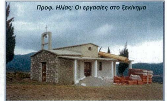
Προφ. Ηλίας: Οι εργασίες στο Ξεκίνημα

Ο Σύλλογος φροντίσει επίσης για το νοικοκύρεμα