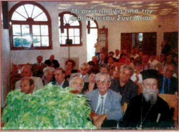
Μερική άποψη από την αίθουσα του Συνεδρίου

Ετόνισε δε ιδιαίτερα την άσχημη συγκυρία του να πραγματοποιείται αυτό το συνέδριο για το περιβάλλον σε μια πόλη η οποία επλήγη τόσο πολύ με τις τελευταίες πυρκαγιές από τις οποίες δοκίμαστηκε τόσο βάναυσα.