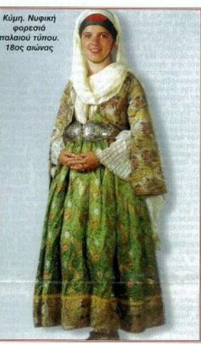
Κύμη, Νυφική φορεσιά παλαιού τύπου, 18ος αιώνας

φορητικής προέλευσης, οι οποίοι όμως με την πάροδο του χρόνου εργλματιστησαν στις συνθήκες του τόπου και μύλων προσαρμόστηκαν στις συνθήκες των γηγενών. Οι αγροτικοί πληθυσμοί καταβήσαν στη γυναικεία α φορεσιά με το σεραιό και στη ανδρική με τη ποικιλία και τη βρούκα για τους άντρες και το φουστάνι για τις γυναίκες.