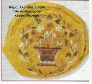
Κύμη, Σκουφία, τμήμα του απλοότερου κεφαλόδεσμου

Το κοινό ποικίλο είναι ντυμένο οκτώμυλο, με λεπτά χρυσοκέντηματα στο άνοιγμα της τηλεπλάκι και στο γύρω των ματιών. Το φουστάνι, φτιαγμένο από οκτώμυλο ευρωπαϊκή στομά, έχει ποδόγυρο από σπό-