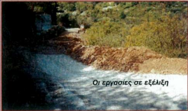
Οι εργασίες σε εξέλιξη

Οι εργασίες αυτές μπορεί να μη λύνουν ριζικά το πρόβλημα που έχει δημιουργηθεί στο σημείο αυτό του δρόμου εξ αιτίας των κατολισθήσεων, αλλά τουλάχιστον αποκαθιστούν τη συγκοινωνιακή επικοινωνία των Δ. Διαμερισμάτων