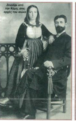
Ζευγάρι από την Κύμη, στις αρχές του αιώνα