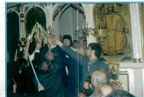
«Δεύτε λάβετε φως, εκ τριου ανεσπέρου φωτός...» και όλοι τρέψαμε να λάβουμε το Άγιος Φως που μόλις είχε φθάσει από τους Αγίους Τόπους