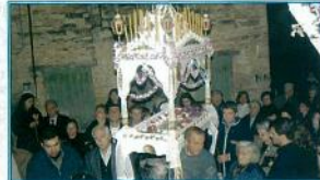
Η περιφορά του Επιταφίου στους δρόμους του χωριού μας