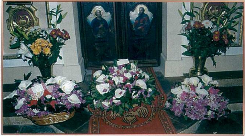
«Εορτή των Βαΐων και οι όμορφοι δίσκοι των νιόπαντρων μπροστά στην Ωραία Πύλη έτοιμοι για ευλογία»

Μ ας αξίωσε ο Κύριος να γιορτάσουμε κι εφέτος το Πάσχα στο μικρό και όμορφο χωριό μας, τους Ανδρονιάνους. Πάσχα με τη φύση να μοιάζει με «απέραντη γαμήλια τελετή», όπως γράφει στο έργο του «Ανοιξιότικη συμφωνία» ο Σπύρος Μελάς. Το μεγαλοβδόμαδο, η Ανάσταση είναι γιορτές της φύσης που δεν τις ξεχωρίζεις από την άνοιξη και τις μοσχοβολιές των λουλουδιών.