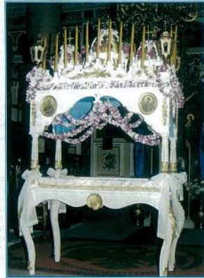
Ο Επιτάφιος του χωριού μας στολισμένος με τις μωβ και άσπρες βιολέτες που στο πέρασμά τους ευωδιάζουν τον αέρα