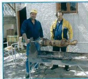
Ο οβελίας είναι έτοιμος να μεταφερθεί στο Παρχαλίνο τραπέζι για το σχετικό «ξεκοκάσιμα»