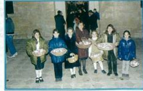
Μικρές κοπέλες «Έρνον τον τάφο» κατά τη διάρκεια της περιφοράς του στους δρόμους του χωριού μας