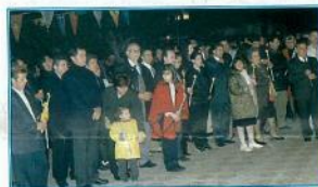
Πλήθος κόσμου παρακολουθούν την τελετή της Ανάστασης στο προαύλιο του ναού μας

Έτσι λοιπόν, τόσο όμορφα, κίλησαν οι φετινές γιορτές της Μεγαλοβδομάδας και του Πάσχα στο μικρό και όμορφο χωριό μας, τους Ανδρονιάνους.