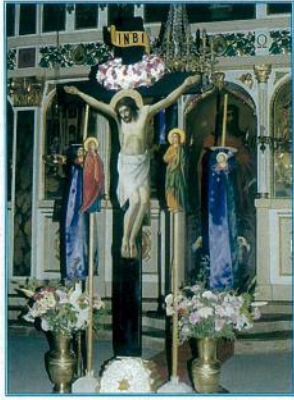
«Σήμερον κρεμάται επί Ξύλου...» και ο Εσταυρωμένος στο κέντρο του ναού μας θυμίζει τη Σταυρική Θυσία του Κυρίου

«Δεύτε λάβετε φως!» αναγράφει ο κείρος στη Λειτουργία του Μεγάλου Σαββάτου και όλοι τρέψαμε να λάβουμε το Αναστάσιο Φως που μίση είχε φθάσει από τους Αγίους Τόπους και να το μεταφέρουμε στα σπίτια μας, ο δυνατός όμως αέρας που φυσούσε δεν βοήθησε πολλούς στη μεταφορά αυτή.