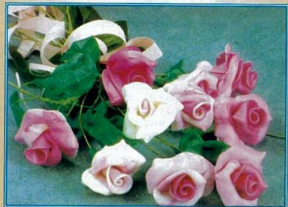
«Αγριοτριαντάφυλλα» Σύνθεση της λουκίας Βαρλάμου