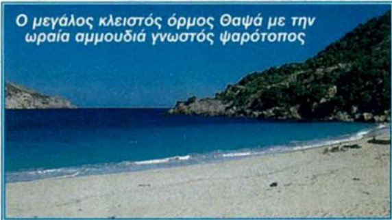
Ο μεγάλος κλειστός όρμος Θαψά με την ωραία αμμουδιά γνωστός ψαρότοπος

Στις 21 Ιουνίου άρχισε το τρίμηνο της εποχής του καλοκαιριού. Μία από τις πιο όμορφες εποχές του χρόνου, εδώ στην Μεσογειακή μας Ελλάδα. Σιγά σιγά άρχισαν και οι διακοπές, οι οποίες θα κορυφωθούν αρχές Αυγούστου. Τα αστικά μας κέντρα θα «αδειάσουν». Ο μισός πληθυσμός θα μεταφερθεί στην περιφέρεια. Το έντονο κυκλοφοριακό πρόβλημα, που ζούμε στην Αθήνα, τον Ιούλιο - Αυγούστο θα το ξεχάσουμε και θα νομίζουμε ότι κυκλοφορούμε σε άλλους τόπους. Προβλήματα όμως θα αντιμετωπίσουμε στα οδικά δίκτυα της περιφέρειας, αφού εκεί θα κινούνται τα αυτοκίνητα που έφυγαν από τα αστικά κέντρα.