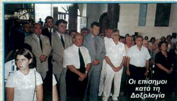
Οι επίσημοι κατά τη Δοξολογία

Πραγματοποιήθηκε η 171η Επέτειος της Απελευθέρωσης της Εύβοιας από τον τουρκικό ζυγό, που διοργάνωσε η Πανευβοϊκή Ομοσπονδία Ελλάδος με τη συνεργασία του Δήμου Στυρών στις 7 και 8 Ιουλίου.