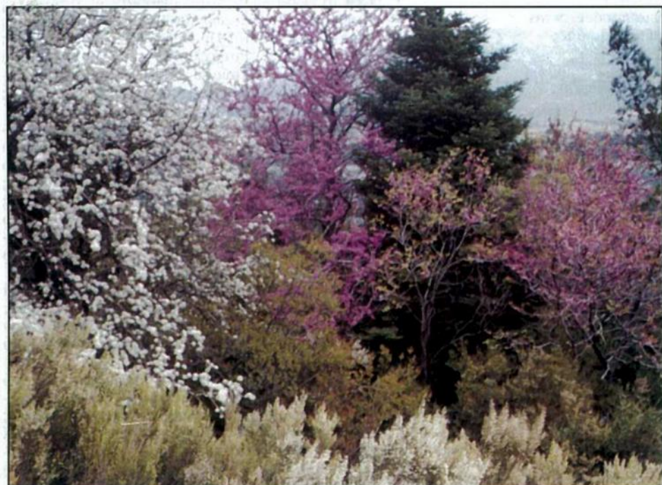
Η γλυκιά φρεσκάδα της Ανοιξης στους Ανδρονιάνους