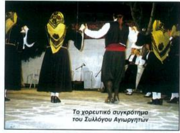
Το χορευτικό συγκρότημα του Συλλόγου Αγιωργητών

Σε αυτό συνετέλεσε η άφορη οργάνωση και η τέλεια προετοιμασία του προαυτίου χώρου στον Αγ. Δημήτρη όπου έγιναν οι περισσότερες των εκδηλώσεων. Πολύ ωραία η βοριά επίσης με το συγκρότημα του Γ. Γεωργίου και το Χορευτικό του Συλλόγου.