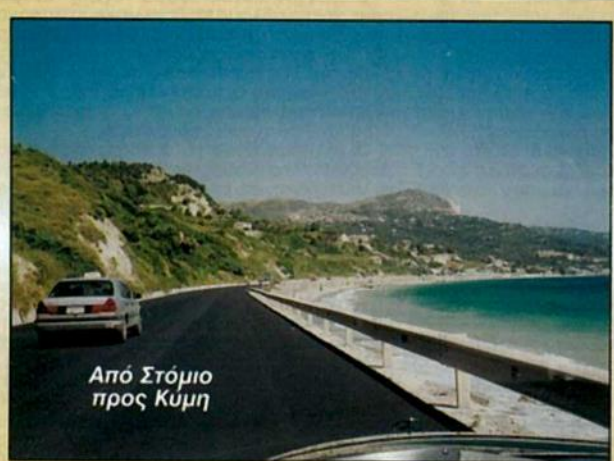
Από Στόμιο προς Κύμη