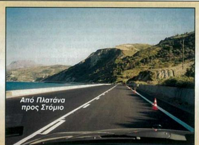
Από Πλατάνια προς Στόμιο

Ετσι από Στόμιο μέχρι Κύμη το οδόστρωμα τώρα είναι ευρωπαϊκής εμφάνισης. Το Δ.Σ. του Συλλόγου μας ευχαριστεί τον Νομάρχη Θ. Μπουρουντά.