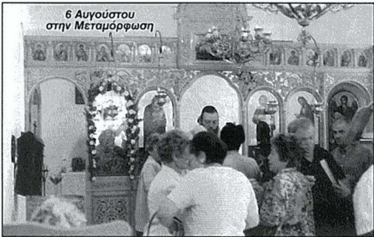
6 Αυγούστου στην Μεταμόρφωση

Στις 26 Ιουλίου η μεγάλη γιορτή της Αγ. Παρασκευής, όπου παραδοσιακά γιορτάζει το πολύ γραφικό εξωκλήσι του χωριού μας. Την προηγούμενη της γιορτής, μετά το τέλος του εσπερινού, έγινε η περιφορά της εικόνας μέχρι τον νε-