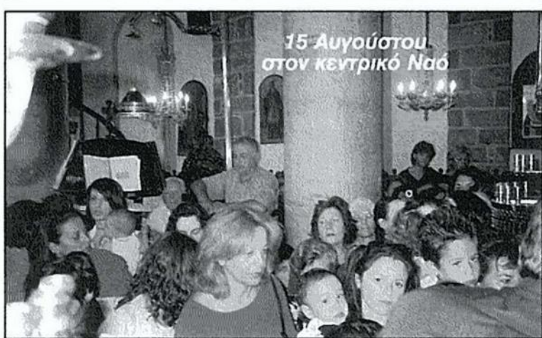
15 Αυγούστου στον κεντρικό Ναό

λώτη την ίδια μέρα δεν γιορτάστηκαν φέτος, λόγω της έλλειψης ιερέα. Τέλος, στις 27 Αυγούστου γιορτάστηκε με κοσμοσυρροή και κατάνυξη η γιορτή του Αγ. Φανουρίου στον ι. ναό Αγ. Ιωάνη Θεολόγου Δένδρων, με τον π. Σ. Δεμερούτη. Πολύς ο κόσμος από τα γύρω χωριά, πολλές και οι παραδοσιακές φανουρόπιτες.