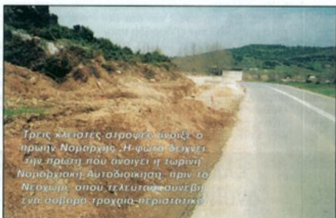
Τρεις καλύτερες στροφές αναίξει ο πρώην Νομαρχης. Η φωτο δείχνει την πρώτη που ανοίγει η τωρινή Νομαρχιακή Αυτοδιοίκηση πριν το ΝΕΟΧΩΜΑ όπου ΤΕΛΕΥΤΑΙΑ συνβίβη ένα σοβαρό τροχαίο-περιστάσιο