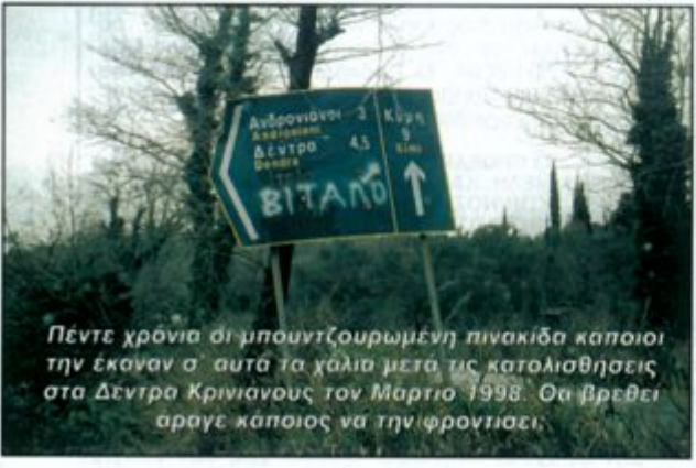
Πέντε χρόνια οι μπουντζουρωμένη πινακίδα κάποιος την εκόμαν σ' αυτά τα γαλία μετά τις κατολισθήσεις στα Δέντρα Κρινιάνους τον Μάρτιο 1998. Θα βρεθεί αργά κάποιος να την φροντίσει.