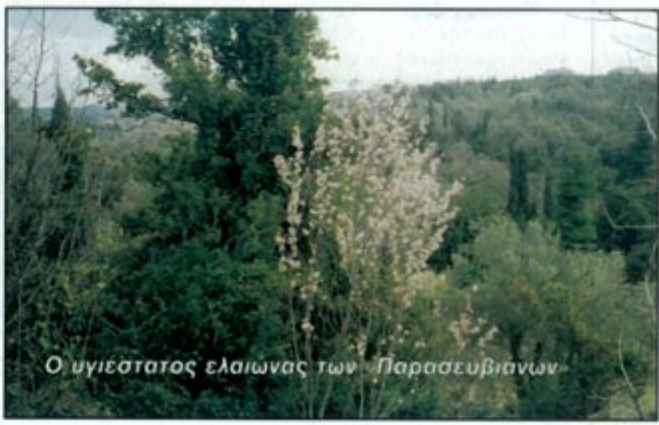
Ο υγιέστατος ελαιώνας των Παρασκευιανών