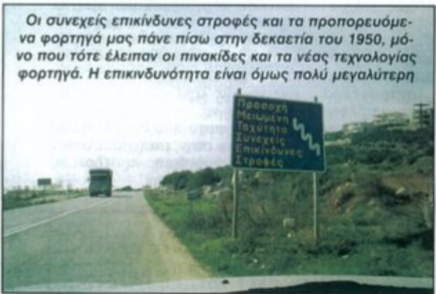
Οι συνεχείς επικίνδυνες στροφές και τα προπορευόμενα φορτηγά μας πάνε πίσω στην δεκαετία του 1950, μόνο που τότε έλειπαν οι πινακίδες και τα νέας τεχνολογίας φορτηγά. Η επικινδυνότητα είναι όμως πολύ μεγαλύτερη