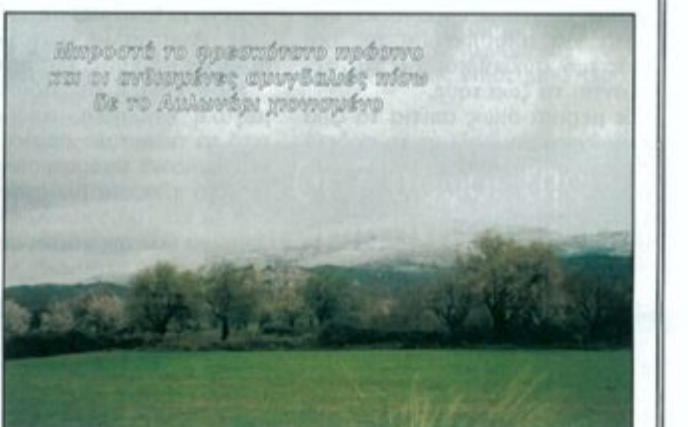
Μικροστά το φρεσκάτο πρόβλετο και οι ανθισμένες αμυγδαλιές πίσω δε το Αιλιανόρι προπορευμένο