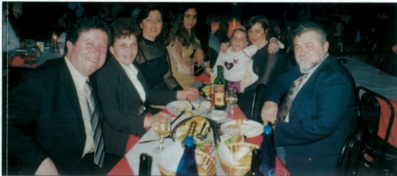
ΣΥΝΕΧΕΙΑ ΑΠΟ ΣΕΛ. 1

κορυφαία γεγονότα της δραστηριότητας του Συλλόγου μας. Ευχαριστούμε τους συγχωριανούς μας για την έγκαιρη δήλωση συμμετοχής η οποία μας βοήθησε στην καλύτερη προετοιμασία και το κλείσιμο του χώρου στο κέντρο PLANET.