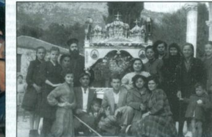
Ο στολισμένος Επιτάφιος κατά την δεκαετία του '50