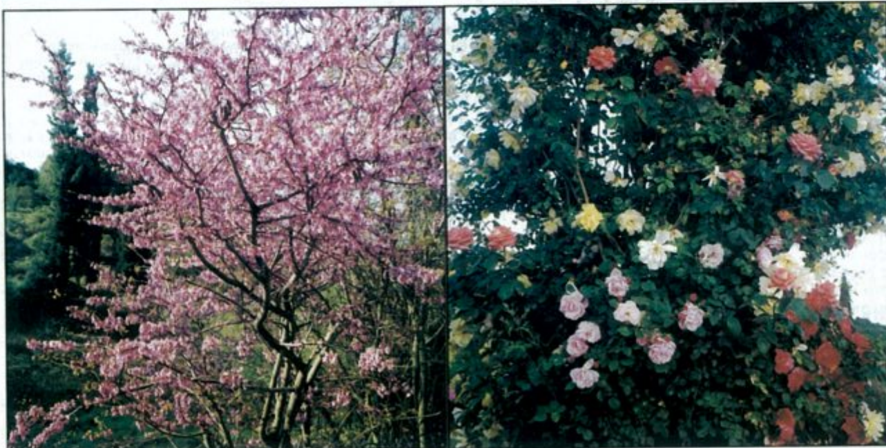
«Αν κάποιος αγαπάει πραγματικά τη φύση, μπορεί να βρει παντού την ομορφιά». Β.Β. ΓΚΟΓΚ (1853 - 1890)