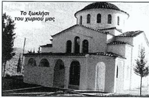
Το ξωκλήσι του χωριού μας

Ο άγιος Γεώργιος, ο Τροπαιοφόρος, είναι ένας από τους πιο γνωστούς αγίους του Χριστιανισμού και από τους περισσότερο τιμώμενους στην Ορθόδοξη Εκκλησία. Γεννήθηκε το 275 στην Καππαδοκία από χριστιανική οικογένεια (πατέρας από την Καππαδοκία και μητέρα από τη Λύδδα της Παλαιστίνης). Μετά τον μαρτυρικό θάνατο του πατέρα του, η μητέρα του τον μετέφερε στη Λύδδα, όπου μορφώθηκε και διακρίθηκε για την ευφύια και την ευγένειά του. Στρατεύθηκε στα 18 του χρόνια στη Νικομήδεια στο τάγμα των τριβούνων (διοικητικών πεζικού) και σύντομα έφθασε σε πολύ ψηλό βαθμό και διάκριση και τελικά πήρε το τίτλο του κόμη, οπότε ως τέτοιος υπηρέτησε ως ιδιαίτερος σύμβουλος του αυτοκράτορα Διοκλητιανού.