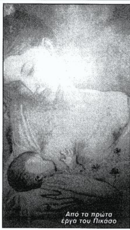
Από τα πρώτα έργα του Πικάσο