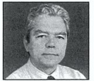
Γράφει ο Σπύρος Δ. Κουσούρης

Κάποιος άλλος τηλεθεατής πήρε αργότερα και πρόσφερε 250.000 ευρώ για την πέννα, θέτοντας κι αυτός παρόμοιο όρο. Αυτός με την απαίτηση να τις δώσει τις 250.000 ευρώ, εάν η κυβέρνηση προτείνει για Πρόεδρο της Ελληνικής Δημοκρατίας την κυρία Γιάννα Αγγελόπουλου Δασκαλάκη. Χαστούκισε έτσι τους γελοιοποιητές της ανθρωπίνης προσπάθειας και των αντοχών του λαού και του ίδιου του Προέδρου κ. Κ. Στεφανόπουλου. Γελάσανε όλοι με το ευφυολόγημα του τηλεθεατού, αλλά απέκρουσαν την προσφορά, ενώ για την περίπτωση Παπούλια, την είχαν βγάλει φαρδιά