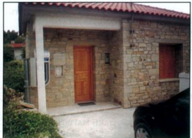
Πάνο το αγροτικό ιατρείο Μαλεσιάνων, ανακαινίστηκε από το Δήμαρχο Κύμης και κάτω το αντίστοιχο Ανδρονιάνων. Η σύγκριση δική σας!!!

Το Δ.Σ. εύχεται σε όλους τους παραπάνω μία πετυχημένη θητεία