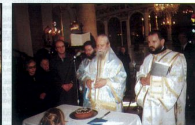
Την Παρασκευή 31.12 ειδοποιήθηκε αφανδία ο Ι. Ναός Εισοδίων της Θεοτόκου, ότι ο Μητροπολίτης Καρυστίας κ. Σεραφείμ θα ιεραουργούσε στον ανωτέρω Ι. Ναό την επομένη Σάββατο 1.1 ημέρα της Πρωτοχρονιάς επειδή δεν θα υπήρχε ιερέας για να λειτουργήσει τον Ι. Ναό.