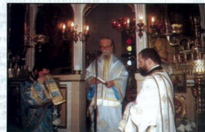
Την Παρασκευή 31.12 ειδοποιήθηκε αφανδία ο Ι. Ναός Εισοδίων της Θεοτόκου, ότι ο Μητροπολίτης Καρυστίας κ. Σεραφείμ θα ιεραουργούσε στον ανωτέρω Ι. Ναό την επομένη Σάββατο 1.1 ημέρα της Πρωτοχρονιάς επειδή δεν θα υπήρχε ιερέας για να λειτουργήσει τον Ι. Ναό.