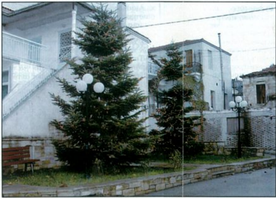
Διά χειρός Προοδευτικού Συλλόγου Ανδρονιάνων

Τ ρίτη 6 Δεκεμβρίου του Αγίου Νικολάου, μόλις είχε φθάσει το Ταχυδρομείο και ήταν η ώρα της αλληλογραφίας. Οι Χριστουγεννιάτικες κάρτες έχουν αρχίσει σιγά - σιγά να κάνουν την εμφάνισή τους. Ανάμεσα στα τιμολόγια, στις παραγγελίες και στα χιλιάδες άλλα χαρτιά που μόνο ποικίλλουν σου δημιουργούν, οι εορταστικές κάρτες είναι μια νότα δροσιάς και ξεγνοιασιάς. Στιγμές που σε ταξιδεύουν στη Βηθλεέμ για τη γέννηση του Χριστού, στους Μάγους με τα δώρα, σε μέρη εξωτικά και τόσα άλλα πράγματα που σε ξεκουράζουν έστω και για μια στιγμή, μέχρι να προσγειωθείς και πάλι στην καθημερινότητα και τον φόρτο εργασίας.