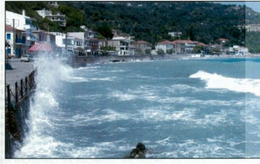
Πλατάνα. Ο Οικισμός και τα παιγνίδια της θάλασσας

Δευτέρα 26 και η μέρα ήταν αφιερωμένη σε βόλτες. Βόλτες με το αυτοκίνητο, στην Αγία Παρασκευή, μένουν να συνεχίσουμε μαζί τη δουλειά. Με περιμένουν να συνεχίσουμε μαζί την αναπόληση των στιγμών που θα βρεθώ και πάλι στο χωριό για να απολαύσω τις ζωντανές κάρτες που μόνο η φύση ξέρει να δημιουργεί. Πλούσια και σήμερα η αλληλογραφία