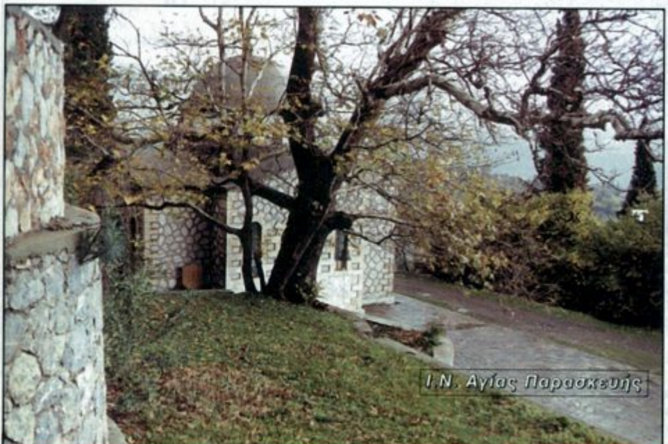
Ι.Ν. Αγίας Παρασκευής

Το απερχόμενο Διοικητικό Συμβούλιο σας εύχεται ένα ευτυχημένο και δημιουργικό Νέο Έτος.