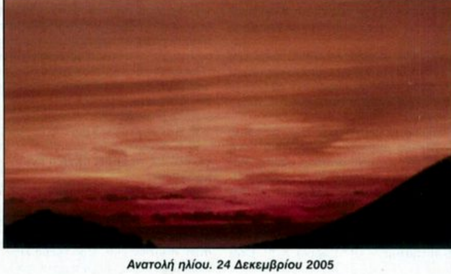
Ανατολή ηλίου. 24 Δεκεμβρίου 2005

Μετά τη Θεία Λειτουργία και το απαραίτητο καφεδάκι, συνοδευμένο μ' ένα υπέροχο μπακαλαβή μυγδαλάτο, πήραμε το δρόμο για το βουνό. Θελήσαμε να πάμε κοντά, να παίξουμε με το χιόνι, να ευχαριστηθούμε αυτό που βλέπαμε από το χωριό. Ο λαμπρός ήλιος θύμψε περισσότερο την Ανοιξη, αλλά το τσουχτερό κρύο μας προσεγίωσα στην πραγματικότητα. Πήραμε το δρόμο από το Βίταλο και στράψαμε για το Μετόχι. Μόλις φθάσαμε ψηλά στα έλατα, το αυτοκίνητο δεν πατούσε στην άσφαλτο αλλά στο υπέροχο άσπρο χαλί που είχε στρωθεί για μας. Θέλαμε να πάμε όσο πιο ψηλά μπορούσαμε. Ευτυχώς το αυτοκίνητο μας έβγαλε ασπροπόσω-