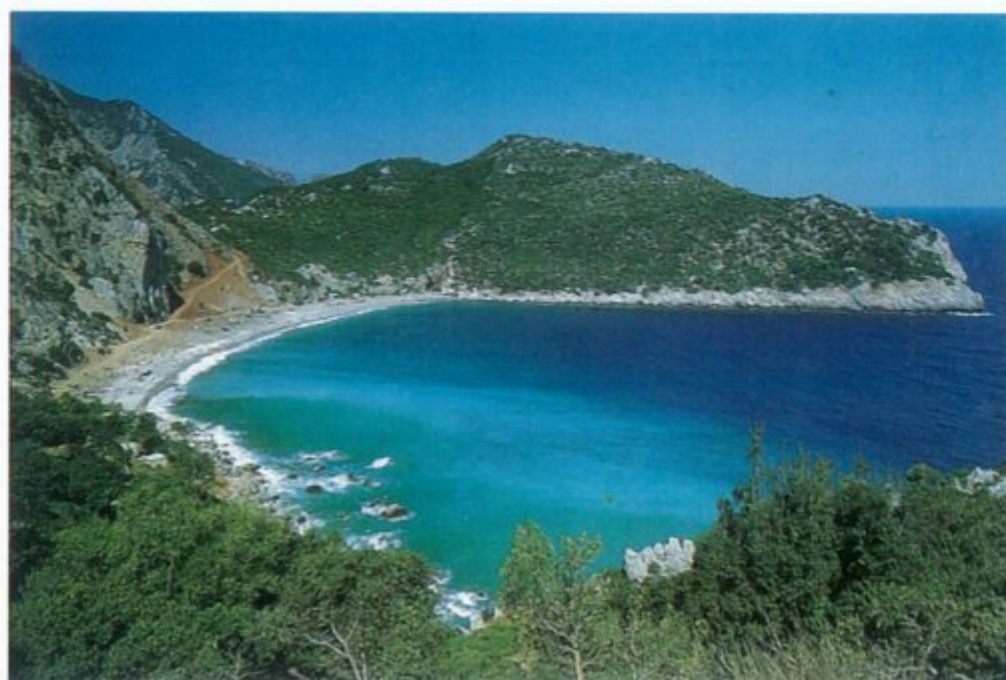
Όρμος Τσίλαρο, ακρογιαλιά που περιβάλλεται από δασομένες πλαγιές, για την οποία υπάρχει πρόσβαση και από την Ξηρά.

Οι συνδρομές θα δημοσιευθούν στο επόμενο φύλλο, λόγω πληθώρας ύλης.