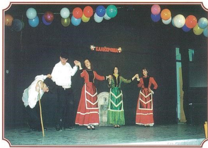
Η υπέροχη χορευτική ομάδα του Παραδοσιακού Χορευτικού Ομίλου Α. Αττικής.