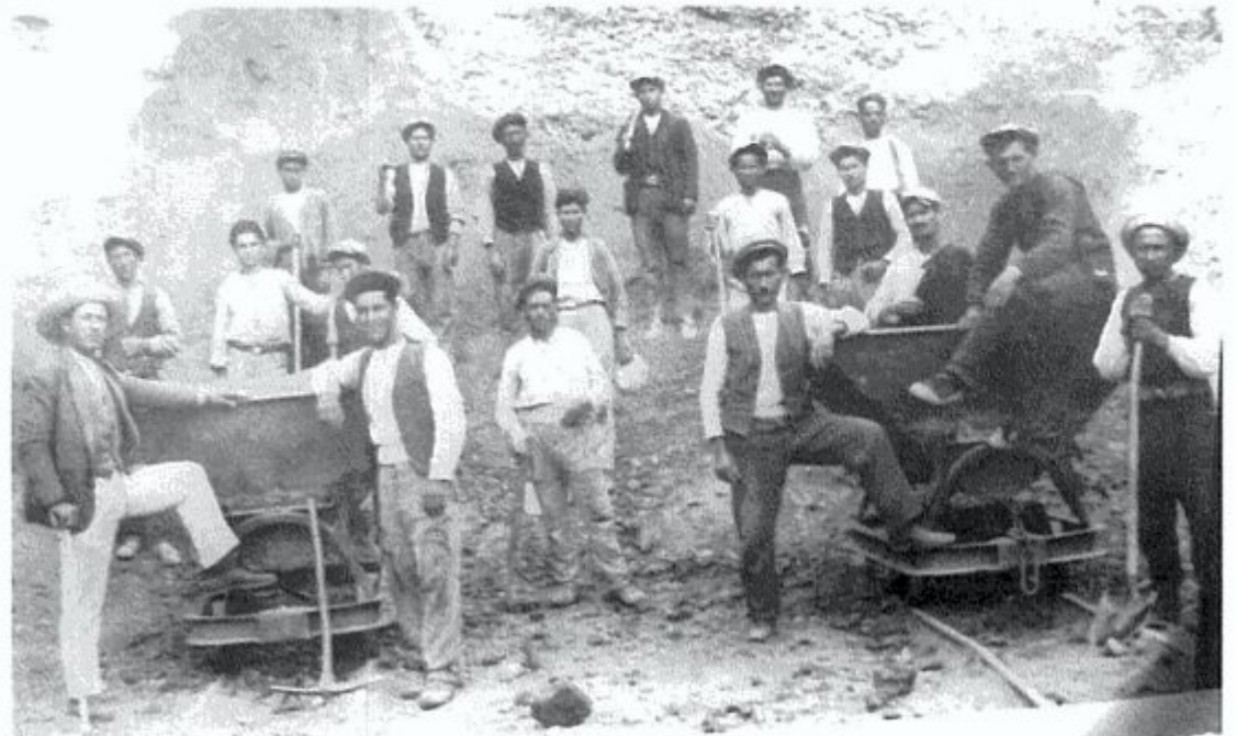
Μία παρέα εργαζομένων στο Ένζυ την δεκαετία 1934-44. Όποιος αναγνωρίζει κάποιους από τους εικονιζόμενους να επικοινωνήσει μαζί μας