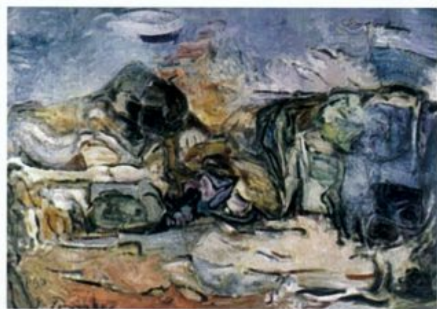
ΟΞΥΛΙΘΟΣ, 1990, 65 x 92

Με αφορμή την αναδρομική έκθεση με τίτλο «Πιερράκος: 70 χρόνια Ζωγραφική» που εγκαινιάστηκε στις 18 Απριλίου στο νέο