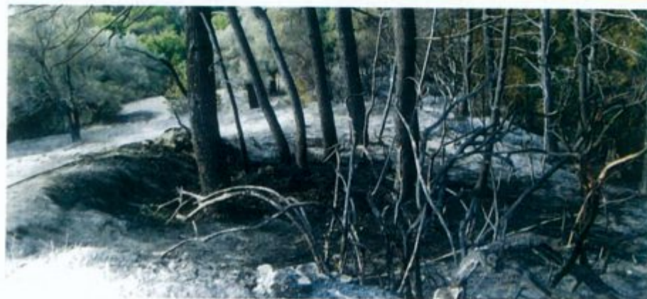
Από εδώ ξεκίνησε η φωτιά στους Ανδρονιάνους. Στροφή Σπίθα