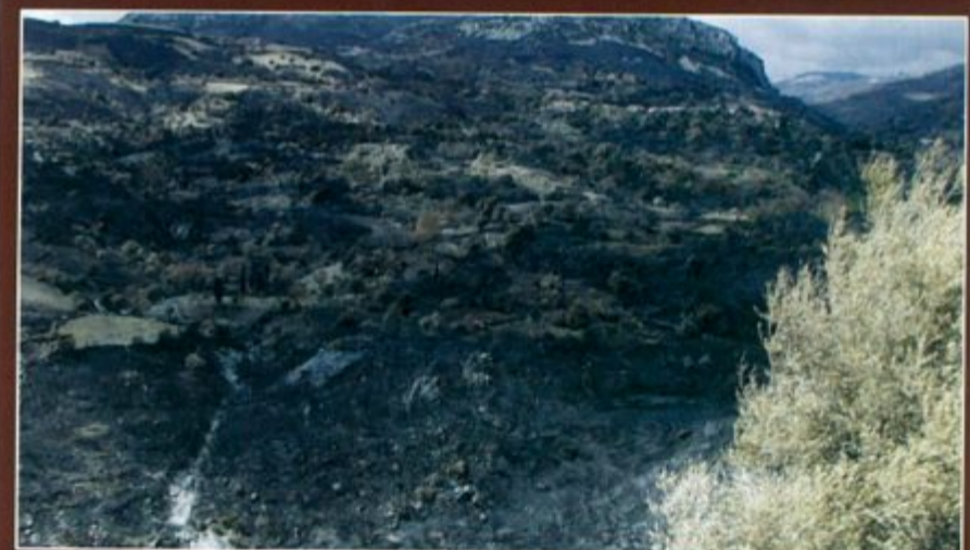
Οι φωτογραφίες από την μεγάλη καταστροφή της πυρκαγιάς στο Δήμο Κοιναστρών