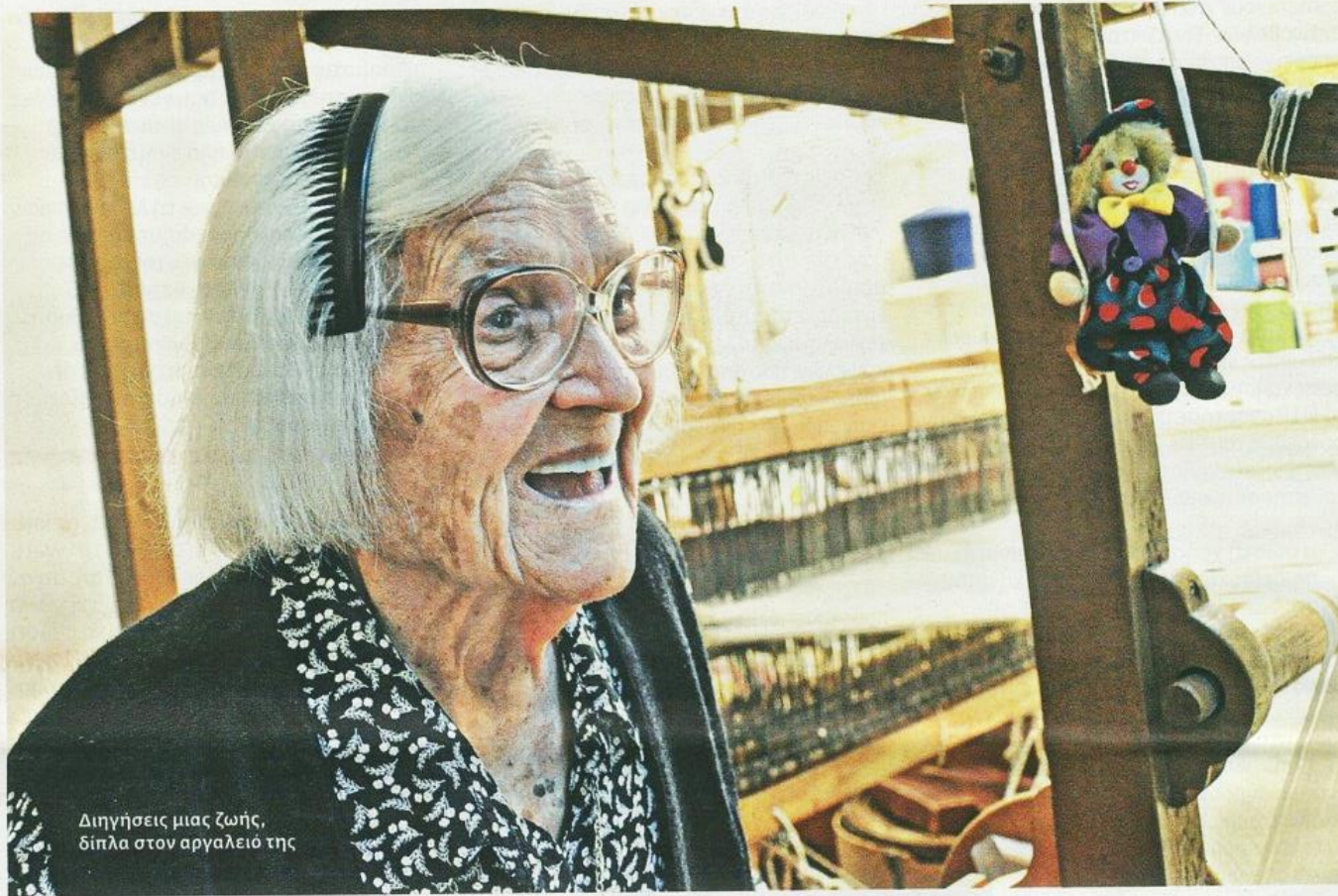
Διηγείσαι μιας ζωής, δίπλα στον αργαλειό της

Παρατηρούμε πως δεν λέει «ο αργαλειός» αλλά «το αργαλειό». Του απευθύνεται σαν